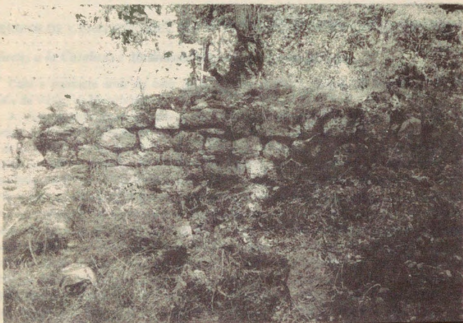
St. Jaume de Frontanyà (vell). (Berguedà)

A l'època en què es construï aquesta modesta parròquia rural, es mancava, quant a l'arquitectura religiosa, de tota manifestació artfística i monumental. L'opulència de la religió no havia arribat per aquestes contrades quan s'erigí l'antiga església de Sant Jaume de Frontanyà.